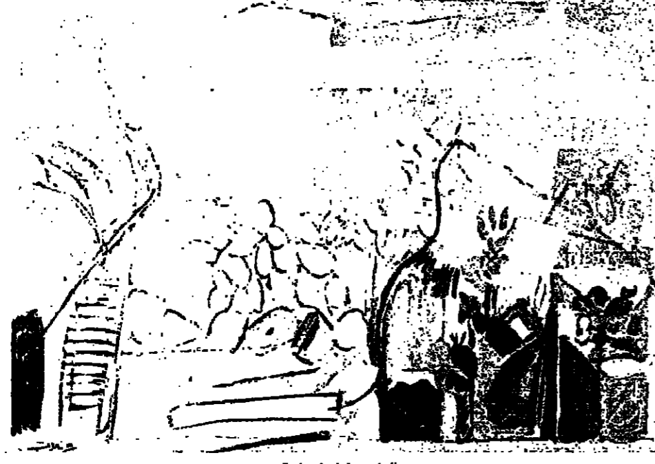
الوان وخطوط ملعبة